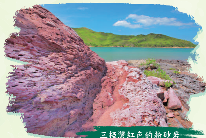
三極灣紅色的粉砂岩

苗三古道主要是泥路及石塊鋪設而成，是昔日客家村民往來大步墟和東和墟的要道，亦是慶春約各村往來、及村民往來兩地購買日用品和售賣自家農產品的要道。苗三古道途經的上、下苗田客家村在歲月的洗禮下只餘下破屋斷牆，和兩塊示意兩村遺址的石牌顯示當年村落的位置。而途經的三極灣更可見紅色的礫岩和粉砂岩，是難得一見的地貌景觀。