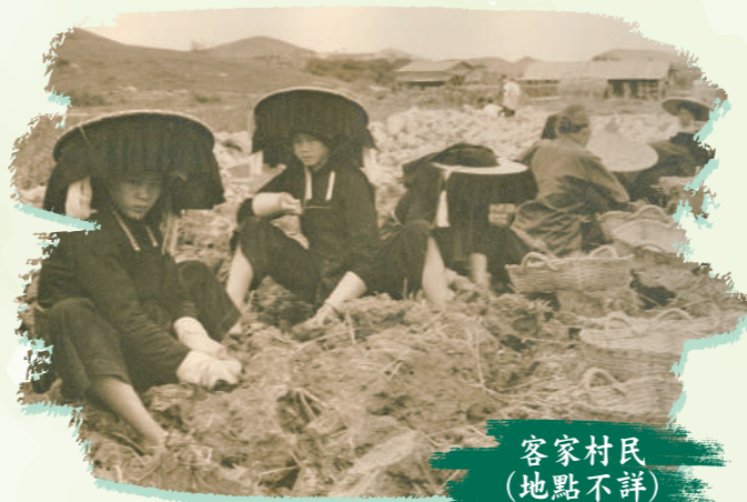
客家村民 (地點不詳)

這是昔日村民往來九龍和沙田的要道，主要由泥土及石塊鋪設而成。據說此為宋朝時期的古驛道，至清朝時期仍是內陸與九龍的主要貿易通道。沙田坳附近有一條百多年歷史的十二笏村，昔日曾氏客家村民以新柴和耕種維生，亦有自製竹籬及器皿在古道旁擺賣，或賣茶給過路人。