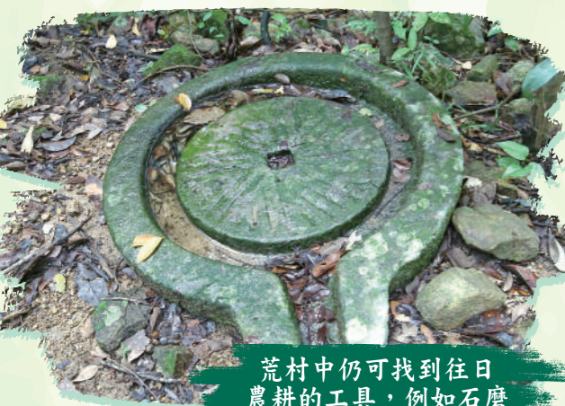
荒村中仍可找到往日農耕的工具，例如石磨

這是昔日客家村民以泥土及石塊興建，用以往來大步墟（後改稱大埔舊墟）和東和墟（即沙頭角）的要道。現在的犁頭石村隱藏於老樹盤纏的密林中，只餘下頹垣敗瓦，據聞村民姓李，村屋外有圍牆，中間有小門樓，村上下的位置有梯田，附近種滿龍眼、黃皮、木瓜等果樹，至七十年代中村屋始被荒廢。