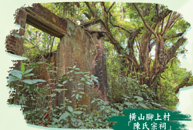
橫山腳上村 「陳氏宗祠」

八仙嶺山腰上有一條以泥土及石塊砌成的古道，始建於十九世紀六十年代，是四條古村村民往來大埔和沙頭角的要道。這條穿梭古村落的小徑名為橫七古道，途經的橫山腳下村、橫山腳上村及七木橋上、下村，現剩下破屋斷牆，只能從散布的遺跡窺探村落往昔的風采。橫山腳下村附近有溪流及梯田遺址，而橫山腳上村的石磴古道仍保存完好，與百年前的風貌沒甚麼兩樣。