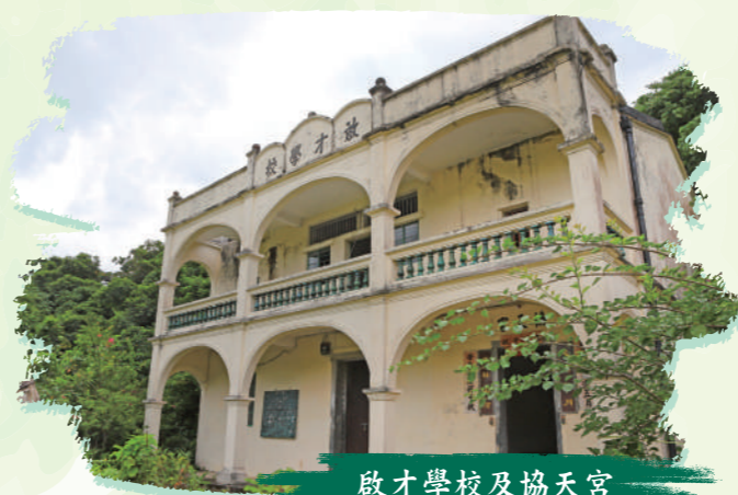
啟才學校及協天宮

荔谷古道連接谷埔村及超過四百年歷史的荔枝窩村，是昔日村民往來大步墟和東和墟的要道。古道途經的谷埔村有一座西式建築風格的卜卜齋（啟才學校）及協天宮，到達有三百多年歷史的荔枝窩則可觀看小瀛學校、鶴山寺、協天宮及二百多間主要以青磚和泥磚建造的房屋。遊一趟荔谷古道，可深深感受客家傳統文化。