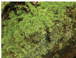
苔蘚 ( _____ 植物)