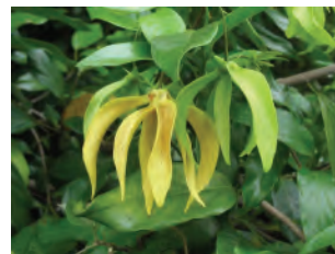
假鷹爪 ( _____ 植物)